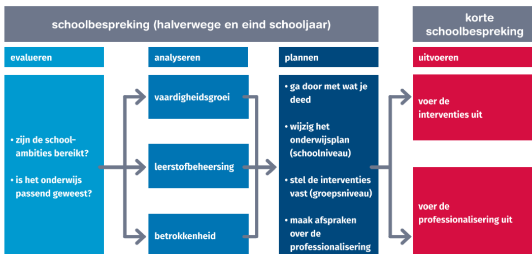
Afbeelding 8: Gespreksstructuur van groepsplanloos werken op school- en groepsniveau. terug naar deel I

Indien geconstateerd wordt dat aanpassingen of interventies (zoals interne of externe ondersteuning) nodig zijn wordt er bekeken of dit op school-, groeps- of bij individuele (groepjes) leerlingen nodig is.