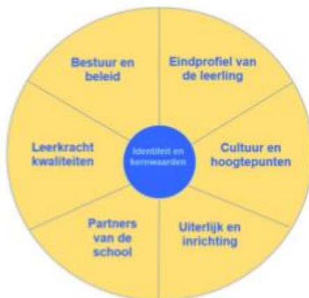
Figuur 1: Zes gebieden rond onze identiteit en kernwaarden.