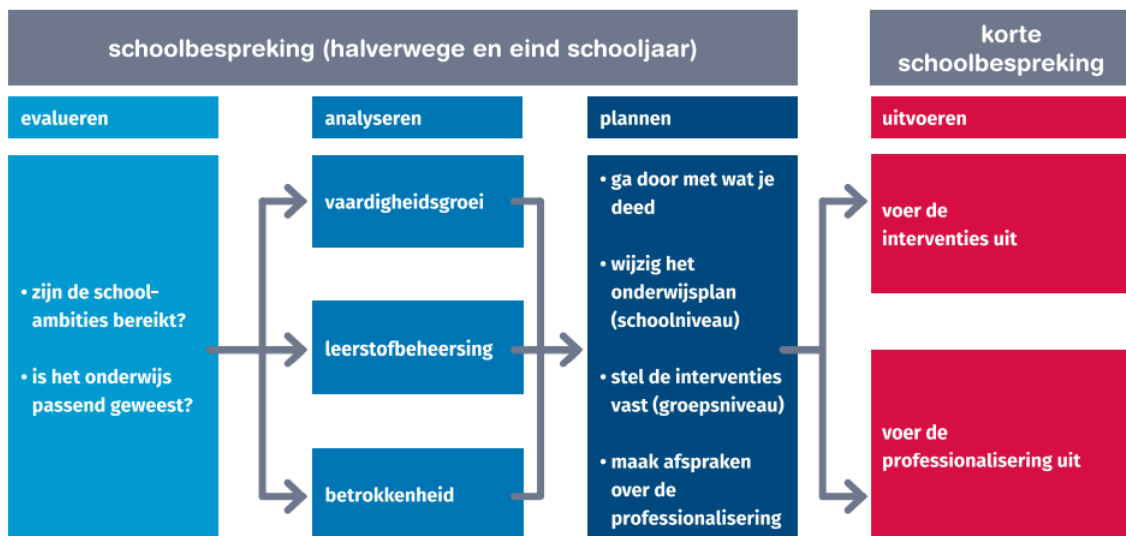
Afbeelding 8: Gespreksstructuur van groepsplanloos werken op school- en groepsniveau. terug naar deel I